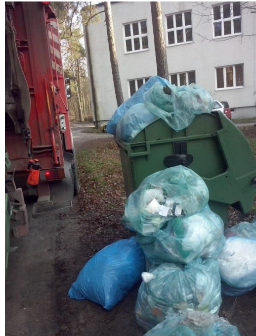
Zdjęcia przedstawiają kontrolę prawidłowej segregacji odpadów w Gorzewie – Szpital ARION MED