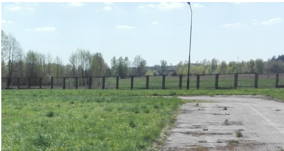
Ryc. 3. Obszar planowanego przedsięwzięcia