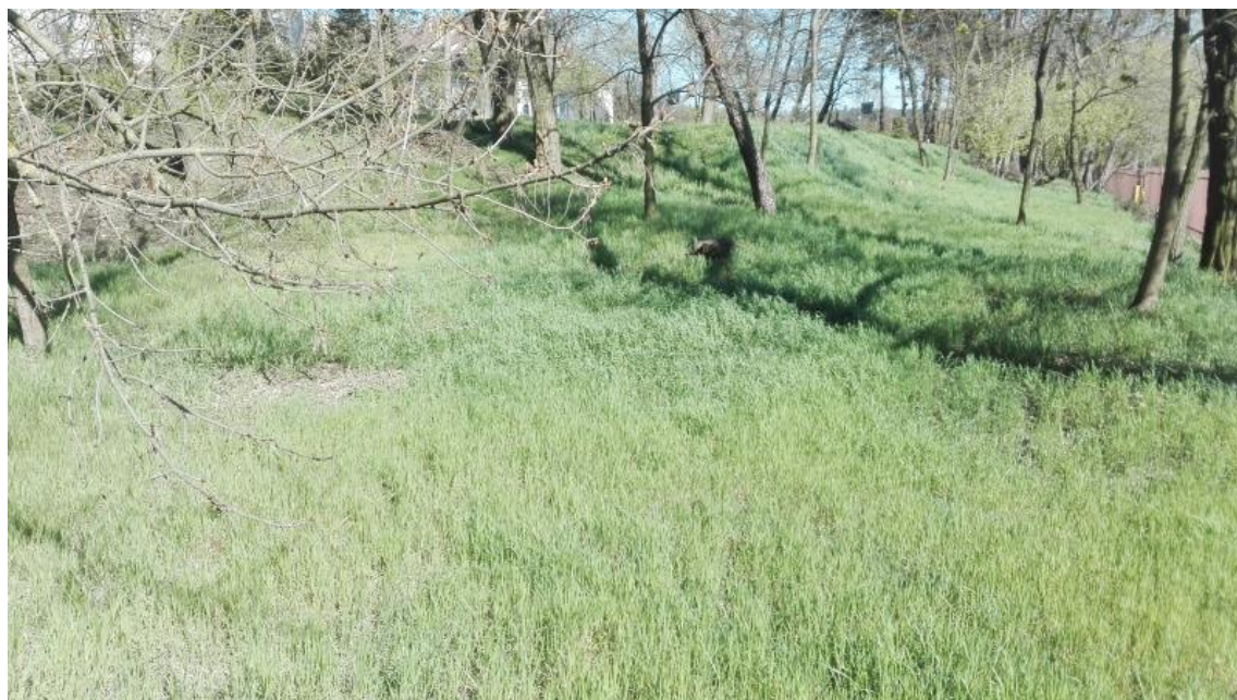
Ryc. 3. Obszar planowanego przedsięwzięcia