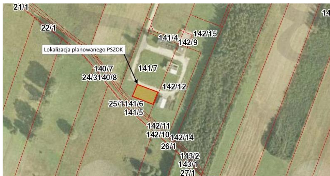
Ryc. 1. Lokalizacja planowanego przedsięwzięcia na terenie gminy