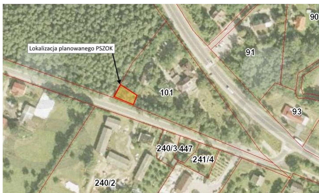
Ryc. 2. Obszar planowanego przedsięwzięcia na terenie przedmiotowego terenu