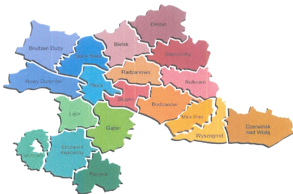
Rysunek 1. Teren Związku Gmin Regionu Płockiego - stan na 2021 rok

Związek Gmin Regionu Płockiego w 2021 roku zrzesza: