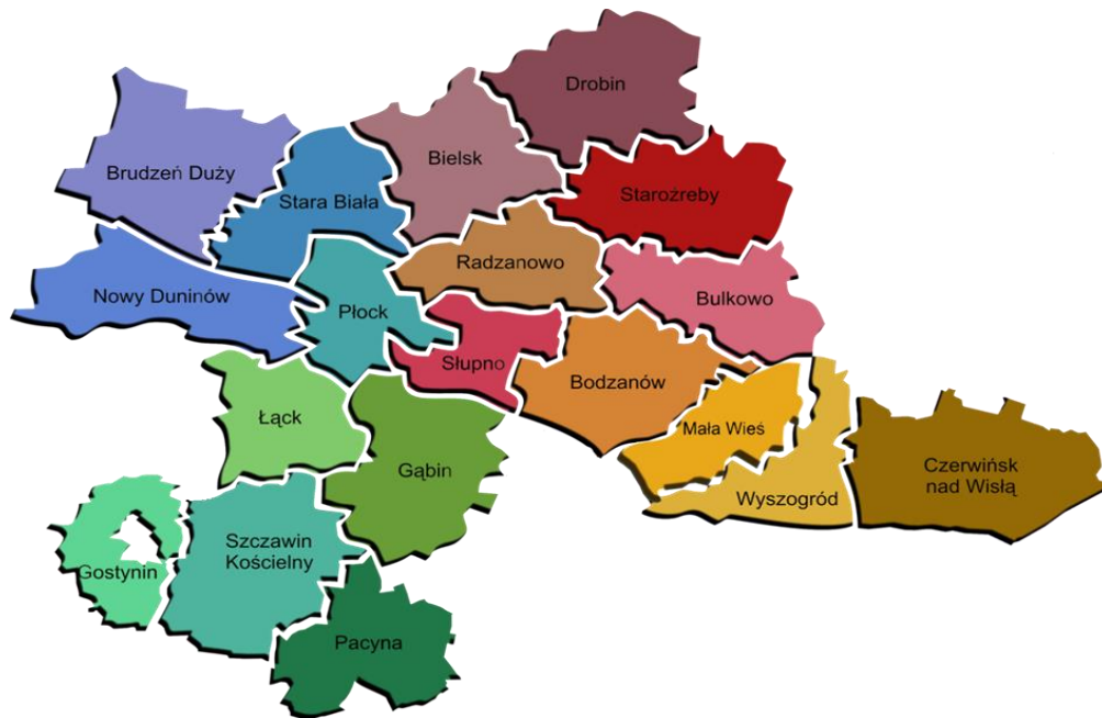
Rysunek 1. Teren Związku Gmin Regionu Płockiego - stan na 2021 rok

Związek Gmin Regionu Płockiego w 2021 roku zrzesza: