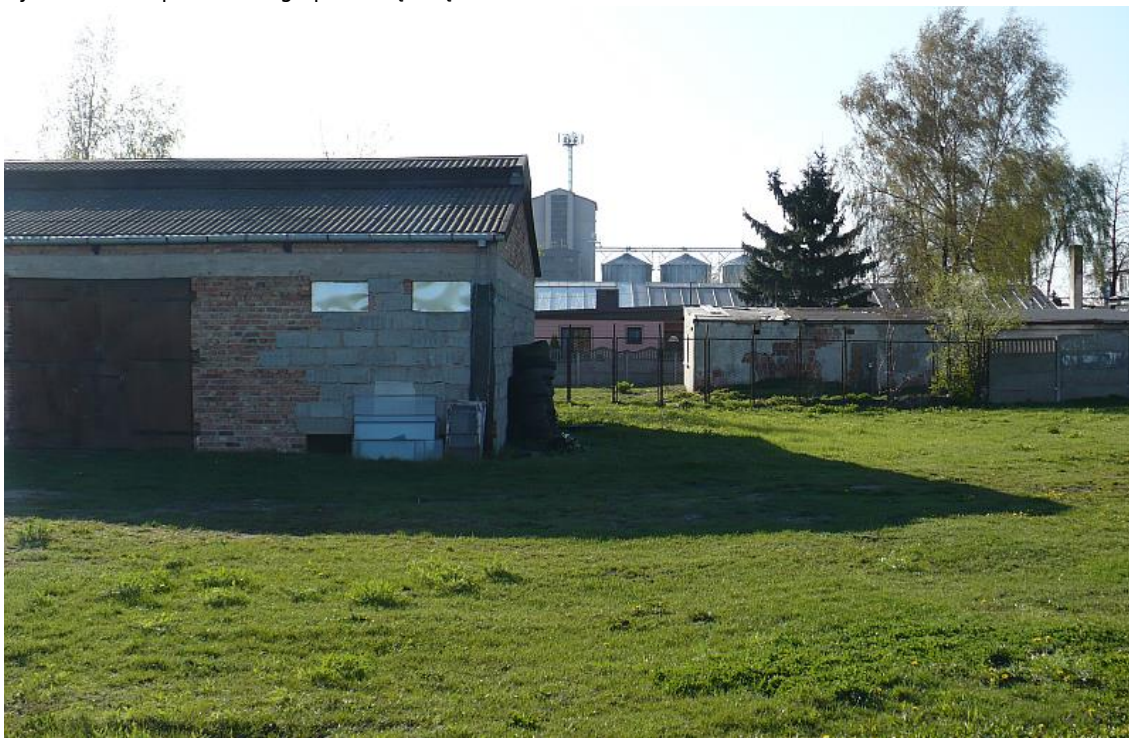
Ryc. 3. Obszar planowanego przedsięwzięcia