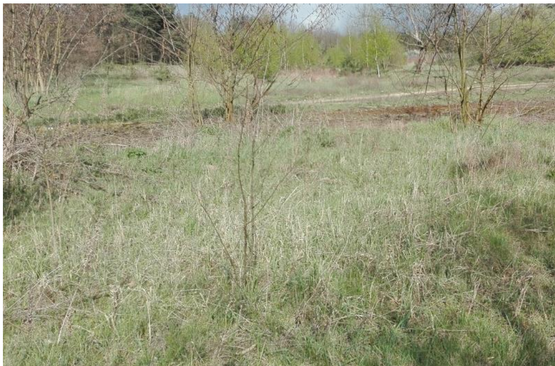
Ryc. 3. Obszar planowanego przedsięwzięcia