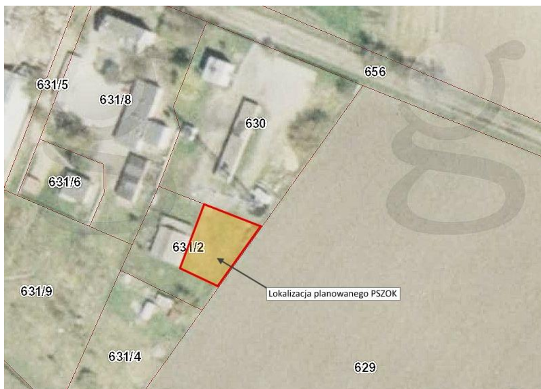
Ryc. 1. Lokalizacja planowanego przedsięwzięcia na terenie gminy