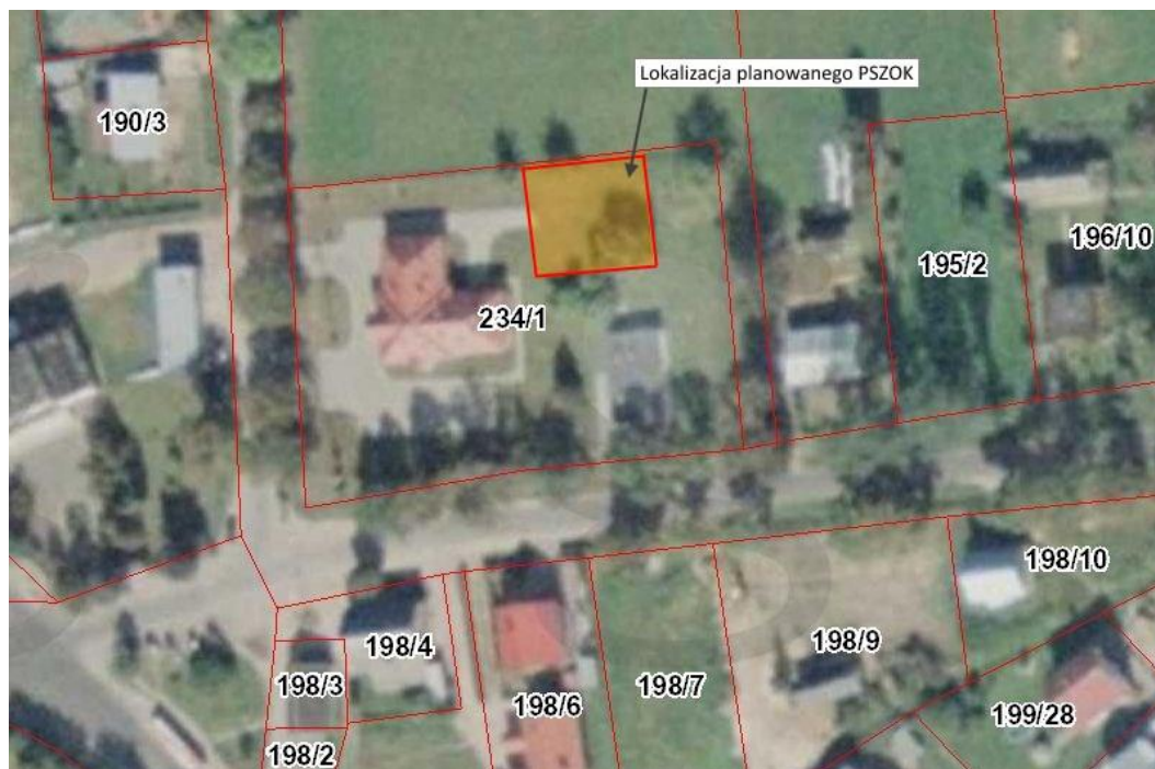
Ryc. 1. Lokalizacja planowanego przedsięwzięcia na terenie gminy