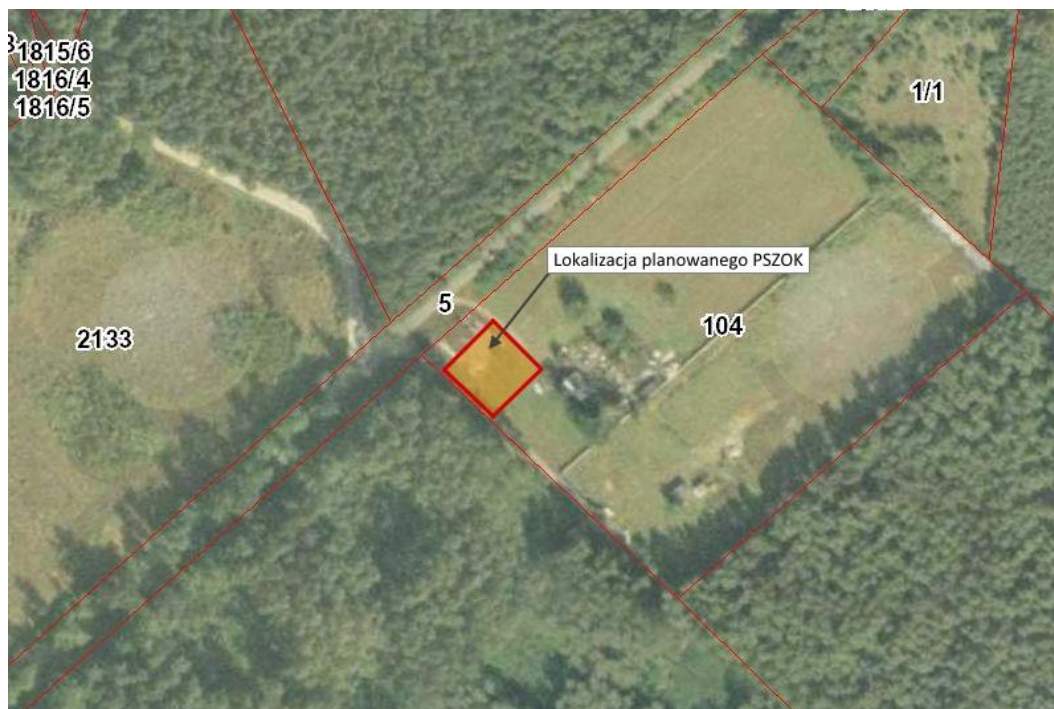
Ryc. 1. Lokalizacja planowanego przedsięwzięcia na terenie gminy