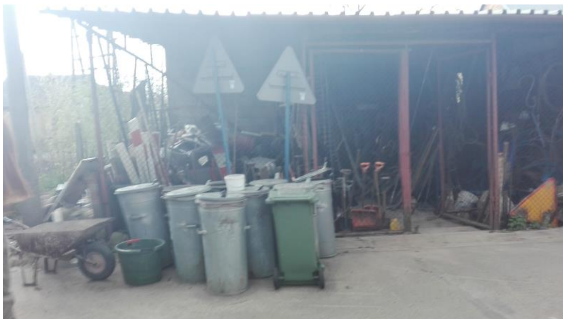
Ryc. 3. Obszar planowanego przedsięwzięcia (po lewej obiekty przeznaczone do remontu i adaptacji, dalej po prawej widoczny parking i teren zielony przewidziany do zagospodarowania jako utwardzony plac magazynowy, widoczny słup oświetleniowy należy zlokalizować poza planowanym placem magazynowym)