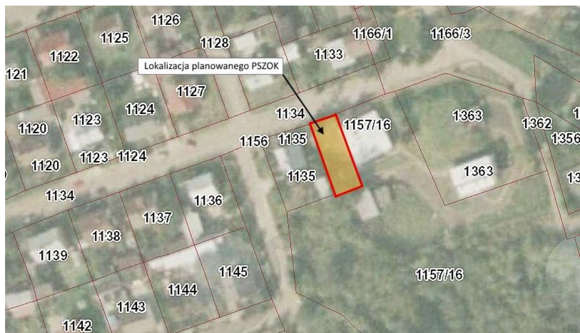
Ryc. 1. Lokalizacja planowanego przedsięwzięcia na terenie gminy