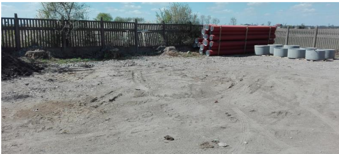
Ryc. 3. Obszar planowanego przedsięwzięcia