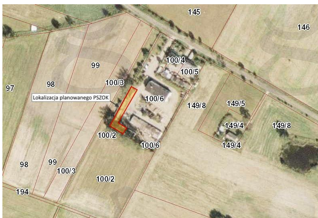
Ryc. 1. Lokalizacja planowanego przedsięwzięcia na terenie gminy