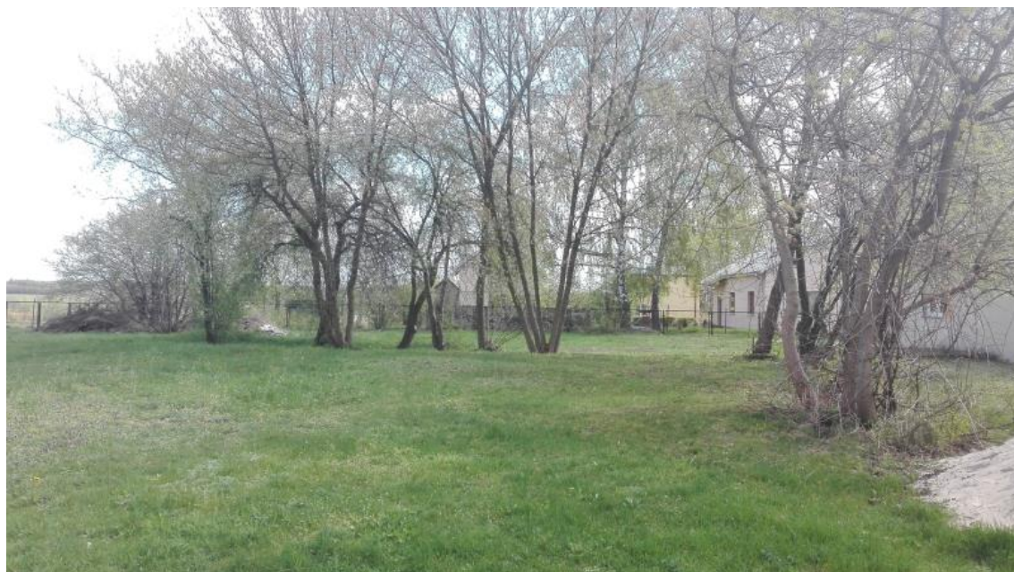
Ryc. 3. Obszar planowanego przedsięwzięcia